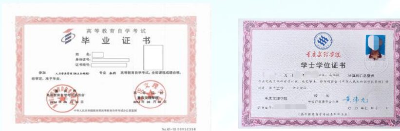
图 1：高等教育自学考试毕业证书、学位证书样本（主考学校：重庆文理学院）

普通本科学生修读自学考试本科是指在校普通本科学生通过课余时间参加国家高等教育自学考试，所有科目考试合格后， 颁发国家承认、教育部可查且独立于第一专业毕业证书之外的高等教育自学考试本科毕业证书 ；符合学士学位授予条件者， 授予高等教育自学考试本科学士学位证书 。